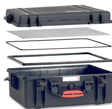
[ HPRCPF-001-01 ]