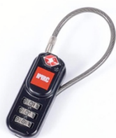
[ HPRCLO ]